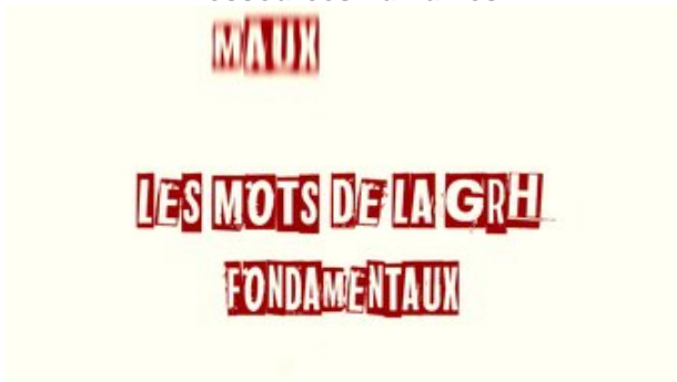
Les mots de la GRH: fondamentaux Inscription jusqu'au 18 octobre