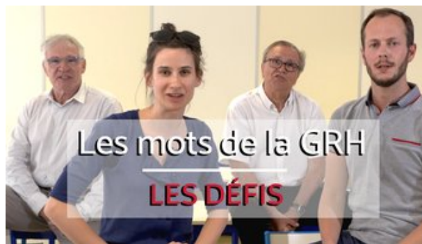
Les mots de la GRH: défis Inscription jusqu'au 16 décembre