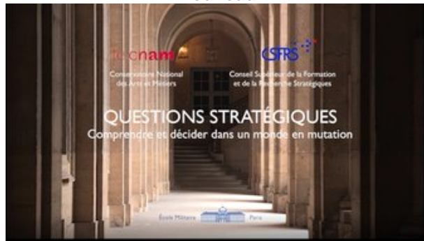
Questions stratégiques: comprendre et décider dans un monde en mutation Inscription jusqu'au 28 octobre