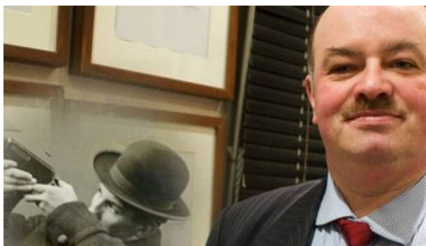
Dernières nouvelles du crime Inscription jusqu'au 25 novembre